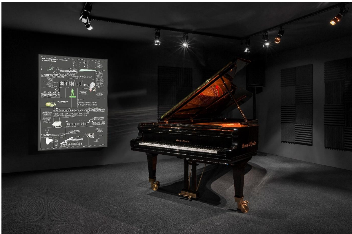
Movement from the Opera, The Ten Murders of Josephine, Act III. 8-Channel Sound installation with Disklavier & Telephone

The Ten Murders of Josephine [The Tongue Twister]