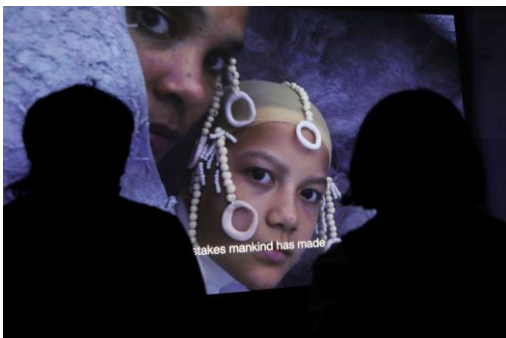
Silvia Martes, To Confirm That You Are Not a Robot, Place a Check in the Box Next to "I'm Not a Robot" (video still), 2021. Eenkanaals film-installatie, grijstinten en kleur, 21 min., 21 sec. Prix de Rome 2021.

Single channel film installation, graytones and color, 21 min., 21 sec. Prix de Rome 2021.